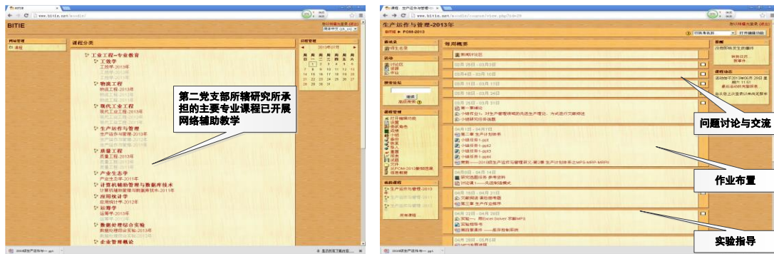
图 3 教学网络化平台