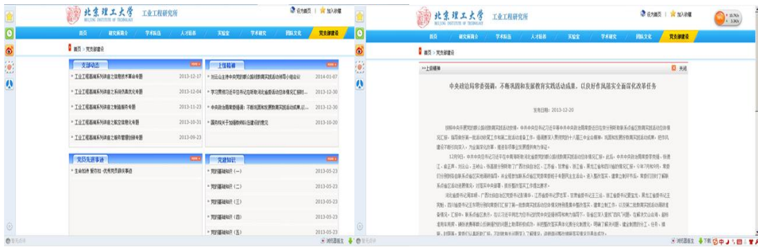
图 2 党支部建设网络化平台